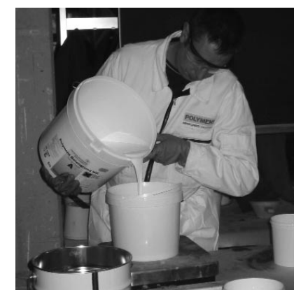
Richtige Schutzausrüstung beim Umgang mit Epoxidharzen