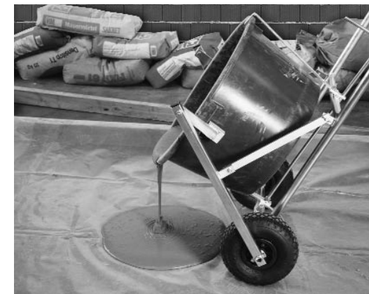
Karre zum Transport und zum Ausgießen

Reaktionswärme zügig ausgegossen und verteilt werden. Bei sehr großen Flächen (z.B. Parkdecks) ist eine Materialverteilung mit Maschinen möglich. Hersteller fragen!