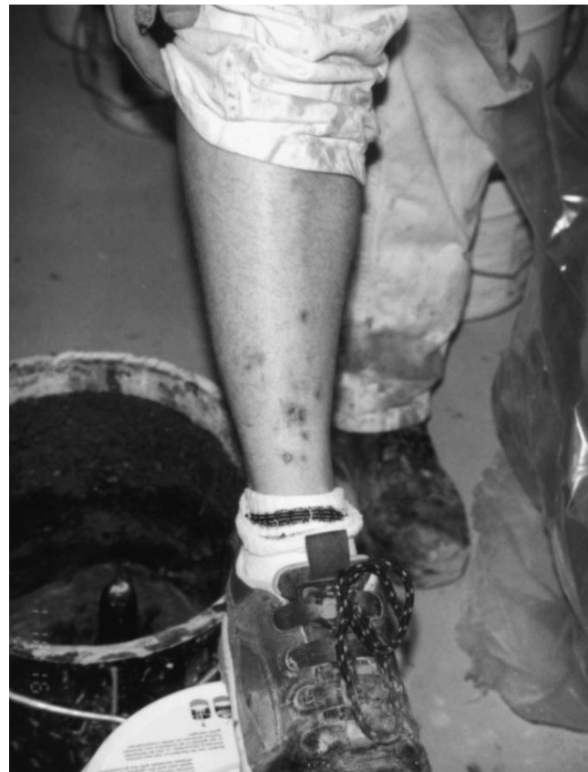
Hautreizung/Verätzung am Unterschenkel durch mit Härter verschmutzte Arbeitshose

Wenn eine Epoxidharzallergie besteht, darf der Betroffene nie wieder mit solchen Produkten arbeiten!