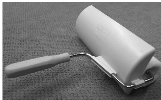
Rolle mit angeklemmtem Spritzschuttschild