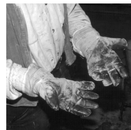
So nicht! Mit Epoxidharz durchtränkte Lederhandschuhe

Bei Verwendung von Lösemitteln oder lösemittelhaltigen Produkten sind auch auf die Lösemittel abgestimmte Handschuhe auszuwählen.