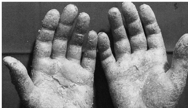
Handekzem durch Epoxidharze

Meistens tritt das allergische Ekzem an Händen, Unterarmen und Beinen auf. Manchmal ist auch das Gesicht betroffen. Hat sich erst einmal eine Epoxidharz-Allergie entwickelt, führt jeder weitere Kontakt mit Epoxidharzen zu immer stärker werdenden allergischen Reaktionen. In diesem Fall kann der Gesundheitszustand des Betroffenen nur verbessert werden, wenn jeglicher Kontakt mit Epoxidharz-Produkten vermieden wird. Dies bedeutet oftmals, dass der Betroffene den Beruf wechseln oder eine andere Tätigkeit übernehmen muss.