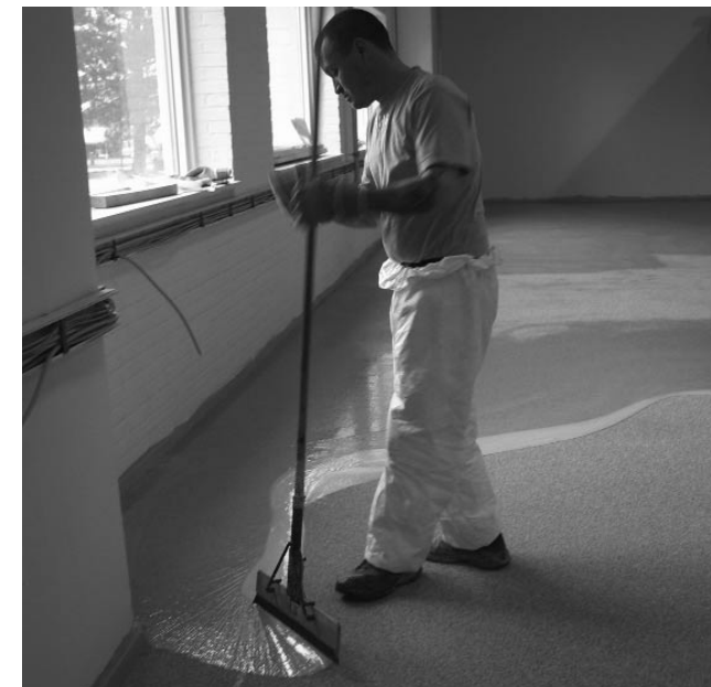
Verteilen von Harz mit einem langstieligen Gummiwischer

Das Material sollte mit langstieligen Rollen aufgerollt oder mit langstieligen Gummiwischern verteilt werden. Dies ermöglicht es, im Stehen zu arbeiten. So reduziert sich das Risiko eines Hautkontaktes.