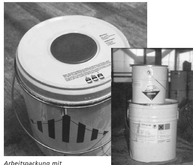
Arbeitspackung mit integriertem Härterbehälter zum Durchstoßen

Können keine Arbeitspackungen verwendet werden, ist eine Waage zur Abmessung der Komponenten zu verwenden. Bei Großgebinden oder Fässern können technische Dosiersysteme verwendet werden. Dazu zählen z.B. Pumpen mit Durchflussmessern .