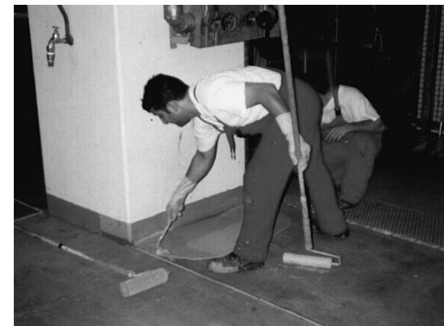
Bodenbeschichtung mit Epoxidharz