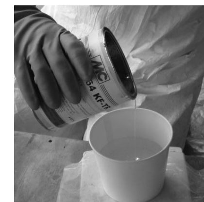
Abwiegen von Harz mit Schutzhandschuhen aus Nitril

Beim Tragen von Schutzhandschuhen sollte Folgendes beachtet werden: