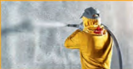
BETONSCHUTZ UND INSTANDHALTUNG