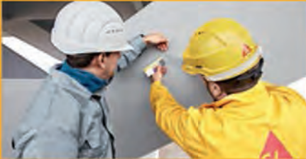
KORROSIONS- UND BRANDSCHUTZ