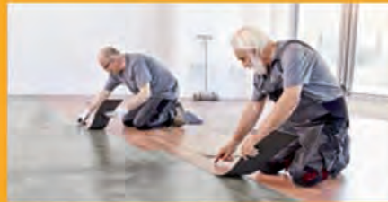
FLIESEN-, WAND- UND FUSSBODENTECHNIK