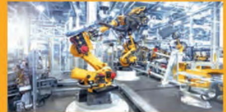
KLEB- UND DICHTSTOFFE FÜR DIE INDUSTRIE