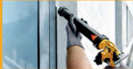
KLEBEN UND DICHTEN AM BAU