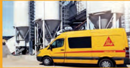
BETON- UND GIPSZUSATZMITTEL