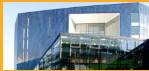
SEALING AND BONDING