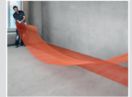
8 Unmittelbar nach Begehrbarkeit kann mit dem Auslegen des Panzergewebes begonnen werden. Um Rollenspannung zu minimieren SCHÖNOX PZG mit der Rolleninnenseite nach unten auslegen.