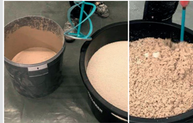
2 Das Spezialbindemittel SCHÖNOX LEB mit 3,25 l kaltem, sauberem Wasser ca. 60 Sekunden anmischen. Leichtfüllstoff SCHÖNOX LEF bei laufendem Rührwerk zugeben und erneut ca. 120 Sekunden mischen.