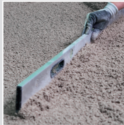
4 Den Leichtestrichmörtel in der Fläche mit einer Richtlatte planeben abziehen.