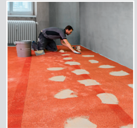
9 Die einzelnen Bahnen mind. 5 cm überlappen und mit SCHÖNOX Q20 HYBRID punktuell auf dem Leichtestrich fixieren.