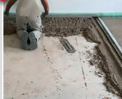
5 Praxis-Tipp: Das Abziehen über Lehren erleichtert das Einhalten der gewünschten Höhen.