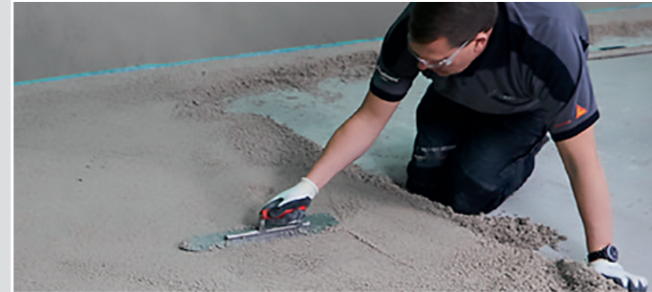
6 Die Oberfläche nach ca. 5-10 Minuten mit dem Glättschwert oder einer Kelle gut verdichten.