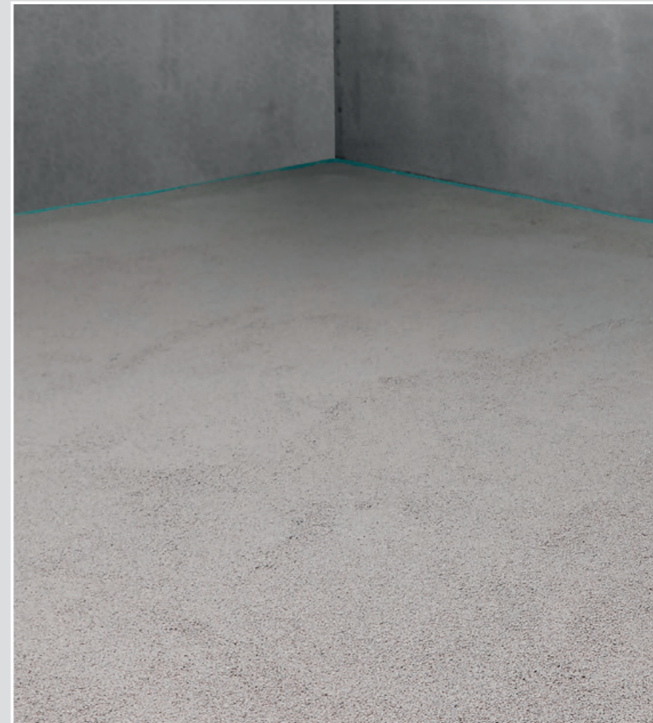
7 Der Leichtestrich ist nach ca. 2 bis 3 Stunden begehbar.