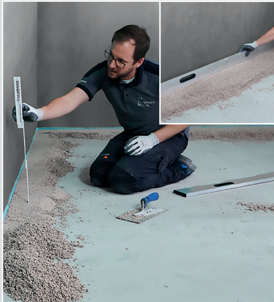
3 Den SCHÖNOX LEICHESTRICH im Randbereich in der gewünschten Schichtdicke vorlegen. Die Kontrolle der genauen Höhen kann unter zur Hilfenahme eines Lasers oder mittels Höhenmesspunkten erfolgen.