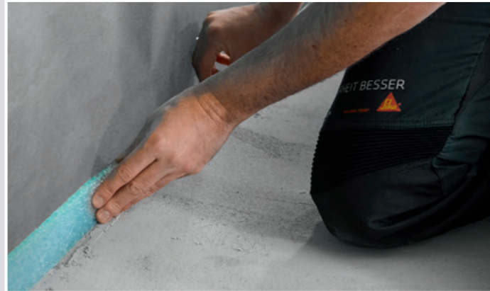
1 Vor Einbringen des Leichtestrichs den SCHÖNOX NIVELLIERSTRIPFEN zu allen aufgehenden Bauteilen aufstellen.

...zur Erstellung von früh belegreifen Estrichflächen mit geringem Flächengewicht.