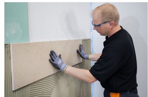
Mit PCI Flexkleber 100 können Fliesen und Platten sicher verlegt werden.