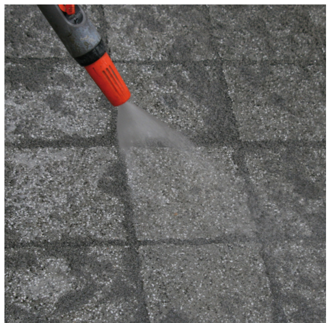
Bei Fugen von 3 - 8 mm das Einbringen in die Fugen mit dem Wasserstrahl unterstützen. Bei besonders schmalen Fugen den Wasserstrahl entlang den Fugen führen. Nachgesackte Fugen sofort mit frischem Material auffüllen.