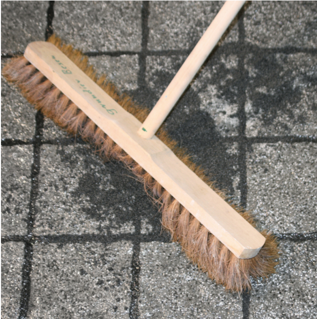
Mörtelreste mit einem weichen Besen vollständig von der Belagsoberfläche entfernen.