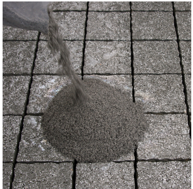
Vakuumbbeutel aufschneiden und frisches Material auf die nasse Belags- oberfläche schütten.