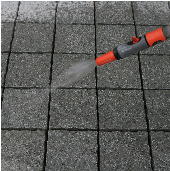
Steinoberfläche und Fugenflanken vor der Verfügung kräftig vornässen.