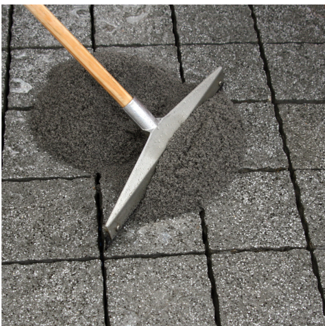
PCI Pavifix 1K Extra mit einem Gummischieber unter Druck in die Fugen einarbeiten.