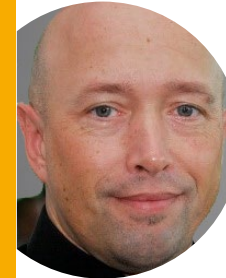
NORBERT DÖPKE Kunden-Service-Center

Mo. – Do. 7:00 – 17:00 Uhr Fr. 7:00 – 16:30 Uhr Tel.: (07 11) 80 09-13 95 kundenservice-membranes@de.sika.com