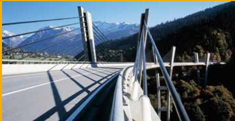
BETONSCHUTZ UND -INSTANDSETZUNG