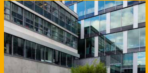
KLEBEN UND DICHTEN IM FASSADENBEREICH

Als Tochterunternehmen der global tätigen Sika AG, Baar/Schweiz, zählt die Sika Deutschland GmbH zu den weltweit führenden Anbietern von bauchemischen Produktsystemen und Dicht- und Klebstoffen für die industrielle Fertigung.