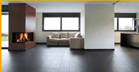
KLEBEN UND DICHTEN IM INNENAUSBAU