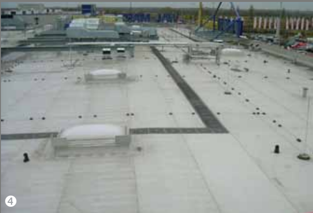
④ Nova Eventis (Saale Park) Günthersdorf