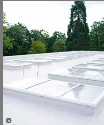
6 Wohlfühltherme Bad Griesbach