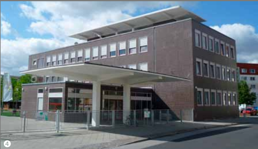
5 Zoologischer Garten Frankfurt/Main