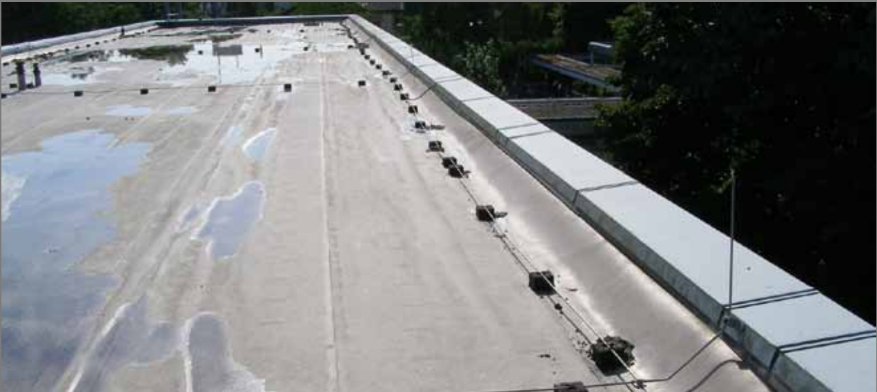
Das Dach der Dorschbergschule in Würth, eine Bitumensanierung, war 1990 die erste in Deutschland verlegte Fläche.