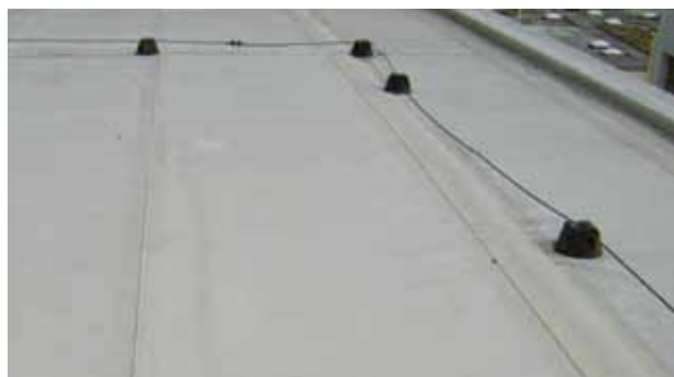
Sarnafil®-Dach von 1990 – damals mit den 1,05 m breiten Bahnen. Aufnahme von heute: Dachfläche, An- und Abschlüsse auch nach 25 Jahren intakt.

Auch nach 25 Jahren arbeiten unsere Forschungs- und Entwicklungsteams permanent an der Weiterentwicklung dieses Produktsystems. Hinsichtlich Zubehör wie Formteile, welche die Verarbeitung von Details enorm erleichtern, werden stetig Neuheiten entwickelt und ins Angebot aufgenommen. So werden den Kunden auch in Zukunft zuverlässige, bewährte Dachsysteme auf dem neusten Stand der Technik angeboten.