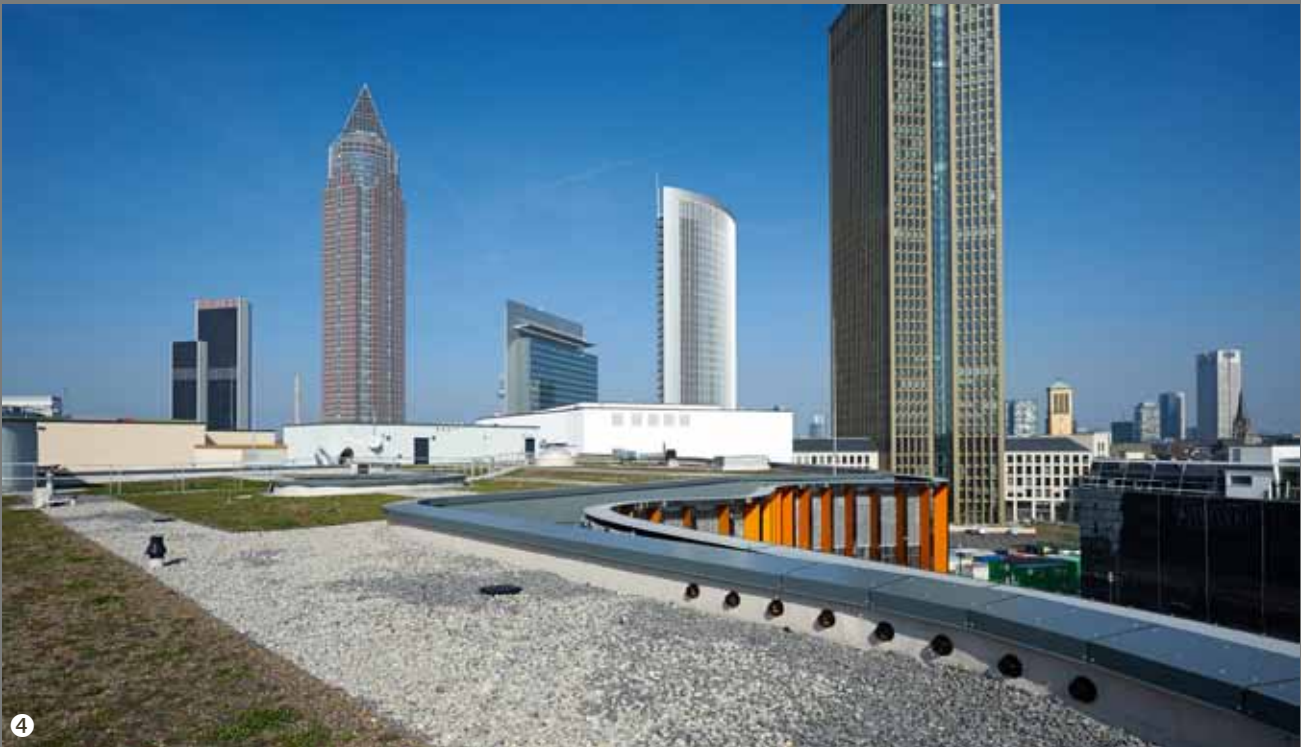
6 Dark Ride Halle Europapark Rust