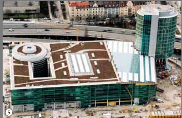
6 Betriebskantine Boehringer Ingelheim