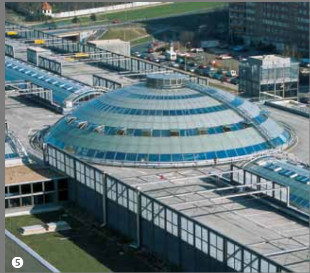
⑥ Dorint-Hotel am Rosengarten Mannheim