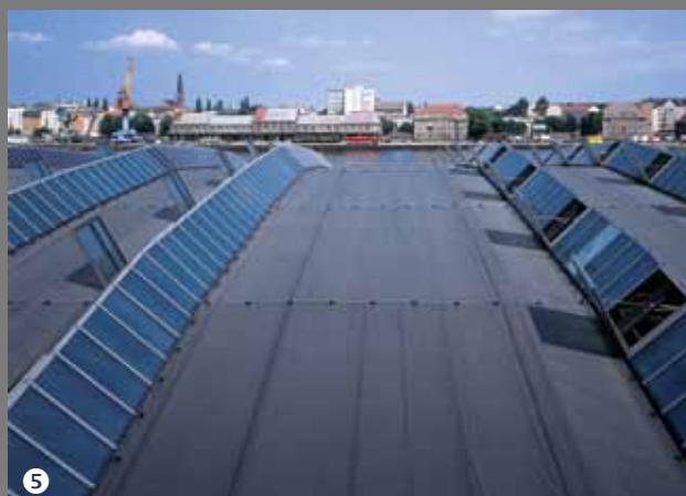
⑥ Bundeskanzleramt Berlin