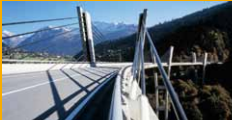
BETONSCHUTZ UND -INSTANDSETZUNG