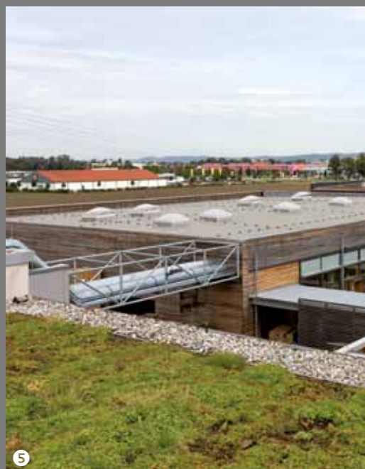
⑥ Solon Berlin