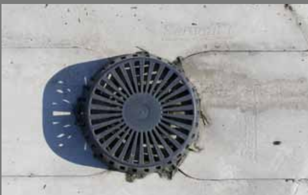
Der Dachwassereinlauf mit den entsprechenden Anschlüssen aus 1990 auf der 1.500 m 2 großen Fläche.

„Es liegen nunmehr über zwei Jahrzehnte nachgewiesene, positive Erfahrungen für die Dauerhaftigkeit von Sarnafil® vor. Die Ergebnisse lassen darauf schließen, dass die Kunststoffdichtungsbahnen des Typs Sarnafil® bei Gewährleistung der Normbedingungen und bei Einhaltung der Anwendungs- und Unterhaltsvorschriften ihre Abdichtungsfunktion weitere Jahrzehnte erfüllen.“