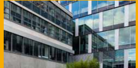
KLEBEN UND DICHTEN IM FASSADENBEREICH