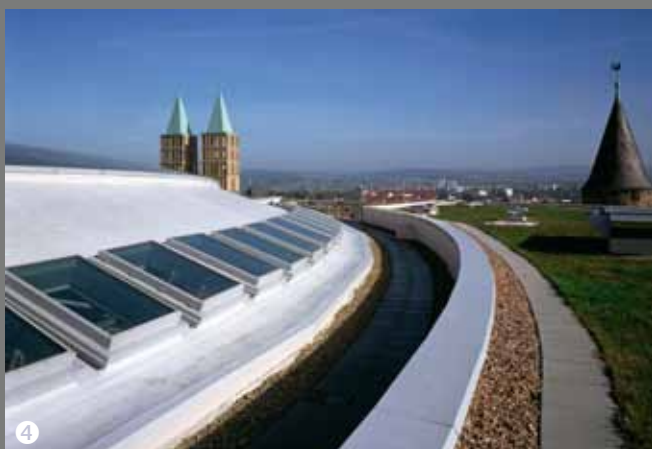
⑤ Arena Berlin