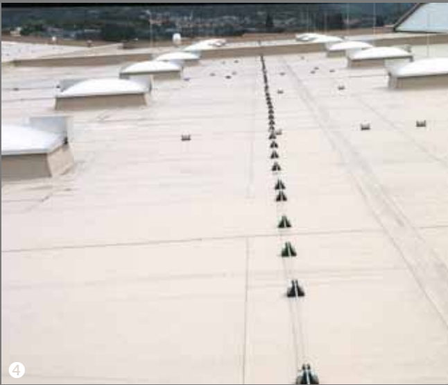
⑤ Allee Center Leipzig