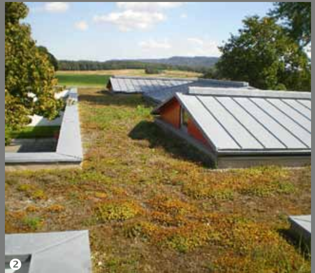
❸ Seniorenheim Diakonieverein Amberg e.V. Amberg