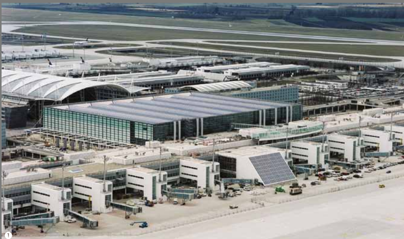
③ Park Hotel Bremen