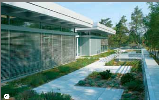
④ Landesfachschule des Dachdeckerhandwerkes Potsdam