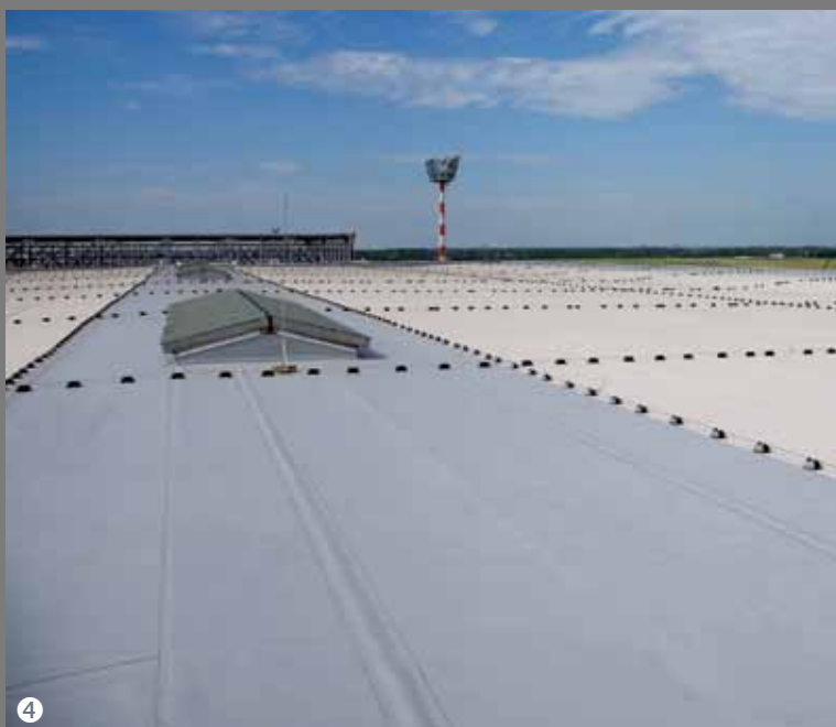
⑤ Ruperti-Werkstätten Altötting