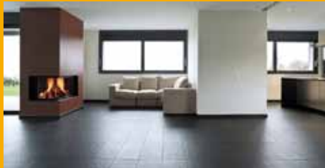
KLEBEN UND DICHTEN IM INNENAUSBAU