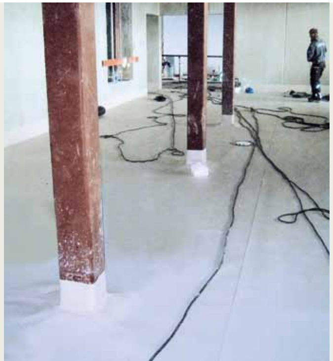
Die Restaurantflächen im Innenbereich wurden mitsamt zahlreicher Stützen ähnlich einer Wanne 15 cm hoch eingedichtet.

sende Detailarbeit ab. Im Detail bedeutete dies: Rund 90 Stragentlüfter und Lichtkuppeln sowie circa 130 Blitzschutzdurchführungen und Sekuranteneinfassungen mussten abgedichtet werden. Hilfreich war dabei das umfangreiche Systemzubehör des Kunststoffbahn-Herstellers Sika.