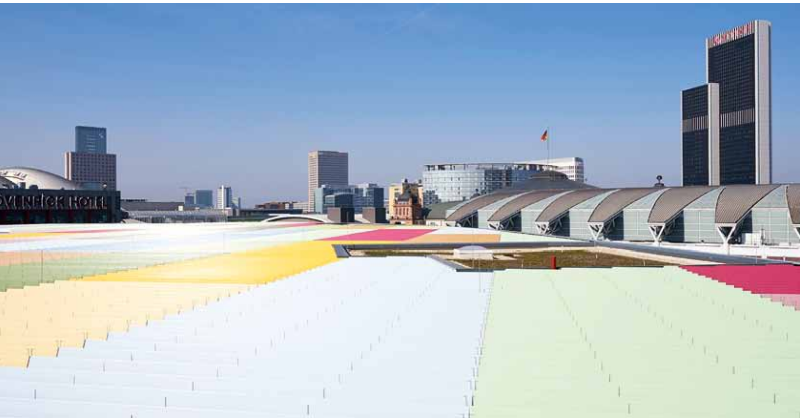
Zwischen Gründach, Kies und Aufenthaltsbereichen sorgen bunte Lamellen für einen lebhaften Kontrast der Mammut-Dachlandschaft.

die Sicherheit der Verleger: Die Sprinklertanks sind innen schlecht belüftet, so musste eine zusätzliche Be- und Entlüftung sichergestellt werden. Dazu wurde Frischluft in die Tanks gepumpt und die Abluft wieder abgesaugt. Weitere Sicherheitsmaßnahmen waren, dass nie eine Person alleine im Tank arbeiten durfte und alle Arbeiter eine persönliche Schutzausrüstung tragen mussten. Mithilfe von Sicherheitsgurten waren die Dachdecker über einen Flaschenzug mit dem Gerüst verbunden, der sie im Notfall in kürzester Zeit aus den Tanks heben konnte. Die Mitarbeiter des Bedachungsunternehmens wurden außerdem umfangreich geschult, um mögliche Gefahren frühzeitig zu erkennen und entsprechend reagieren zu können. Projektleiter der Pohlen Bedachungen, Dipl.-Ing. Andreas Peschen: „Aufgrund der langjährigen Erfahrung unserer Mitarbeiter mit den Sika-Produkten können solche vielseitigen Projekte wie die Skyline Plaza erfolgreich umgesetzt werden. Wir sind ein Dachdeckerbetrieb mit geschulten und nach TÜV-