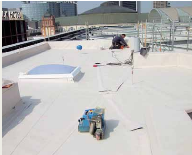
Nachdem die Befestigungsschienen verschraubt sind, werden die Metallprofile mit einem vorgefertigten Abdichtungsband per Heißluft-Schweißautomat verschweißt.

ren Abdichtungsarbeiten innerhalb des Gebäudes beauftragt wurde. Auf den auf mehreren Ebenen angelegten Dachflächen der Skyline Plaza verlegten die Dachdecker zunächst eine bituminöse Dampfsperre