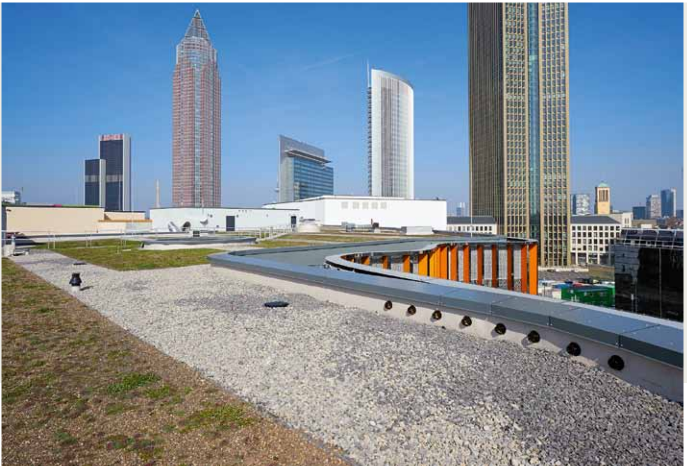
Eine ausgeklügelte Notentwässerungsebene von mehreren parallel nebeneinander sitzenden Notabläufen wurde in die Attika-Bereiche eingefügt.