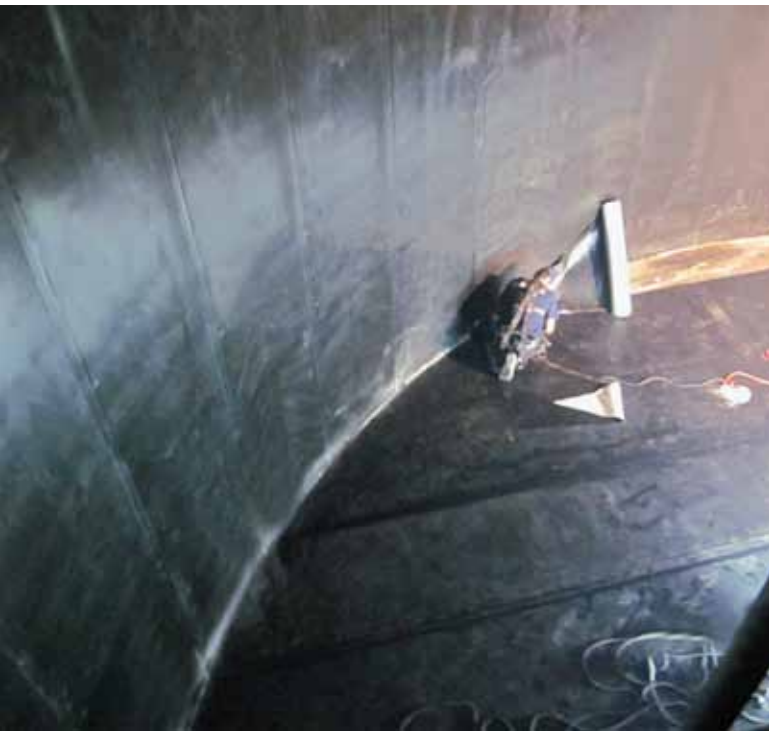
Für die Abdichtung der Sprinklertanks mussten spezielle Anforderungen zur Sicherheit der Dachdecker eingehalten werden. Frischluft wurde eingepumpt und die Abluft wieder abgesaugt. Auch wurden die Arbeiten immer im Team von mindestens 2 Personen durchgeführt.