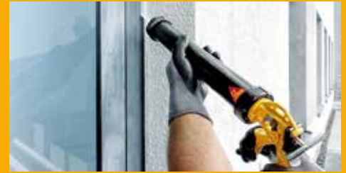
KLEBEN UND DICHTEN AM BAU