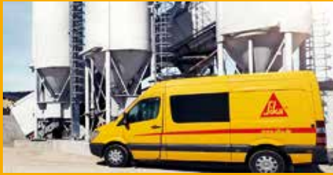
BETON- UND GIPSZUSATZMITTEL