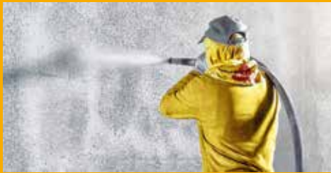
BETONSCHUTZ UND INSTANDHALTUNG