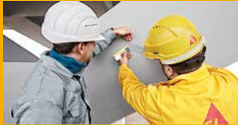
KORROSIONS- UND BRANDSCHUTZ