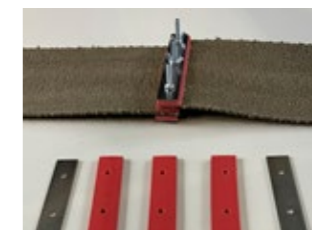
Sika® Klemmlasche KS 12 (174374) für die mechanisch fixierte, überlappende Stoßverbindung und für den Anschluss an alle Arten von Fugenbändern

Vor Verwendung und Verarbeitung ist stets das aktuelle Produktdatenblatt der verwendeten Produkte zu konsultieren. Es gelten unsere jeweils aktuellen Allgemeinen Geschäftsbedingungen.