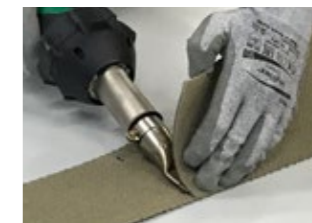
Heißluftgebläse Leister Triac AT (153906) für die Stoßverbindung mittels homogener Überlappschweißung