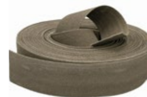
Sika Waterbar FB-125 (674002), Rollenlänge 50 m, Breite 125 mm