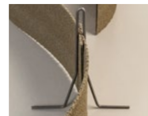
Sika Waterbar FB Haldebügel (692357) zur mechanischen Fixierung