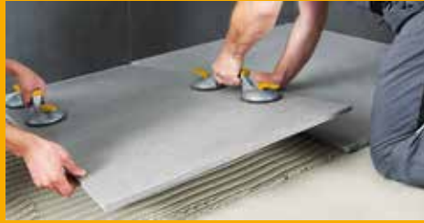
FLIESEN-, WAND- UND FUSSBODENTECHNIK