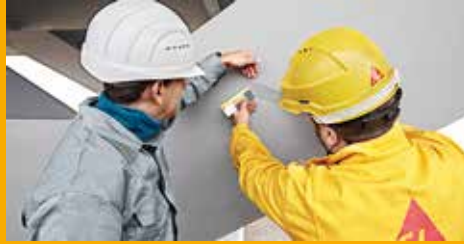
KORROSIONS- UND BRANDSCHUTZ