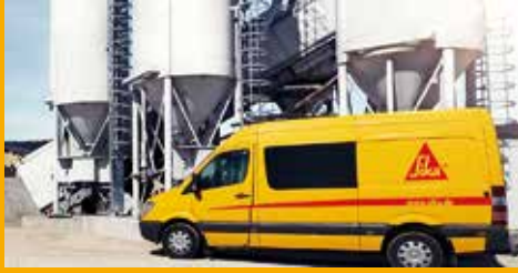
BETON- UND GIPSZUSATZMITTEL