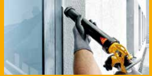
KLEBEN UND DICHTEN AM BAU