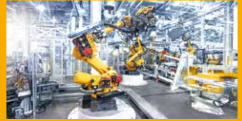
KLEB- UND DICHTSTOFFE FÜR DIE INDUSTRIE

Als Tochterunternehmen der global tätigen Sika AG, Baar/Schweiz, zählt die Sika Deutschland GmbH zu den weltweit führenden Anbietern von bauchemischen Produktsystemen und Dicht- und Klebstoffen für die industrielle Fertigung.