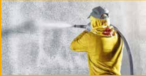
BETONSCHUTZ UND INSTANDHALTUNG